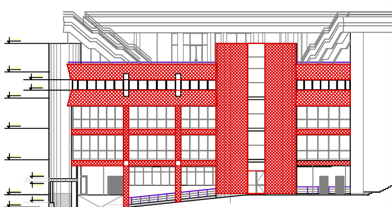
СЕКЦИЯ №5 Схема к смете на окраску фасада по вопросу №11.1